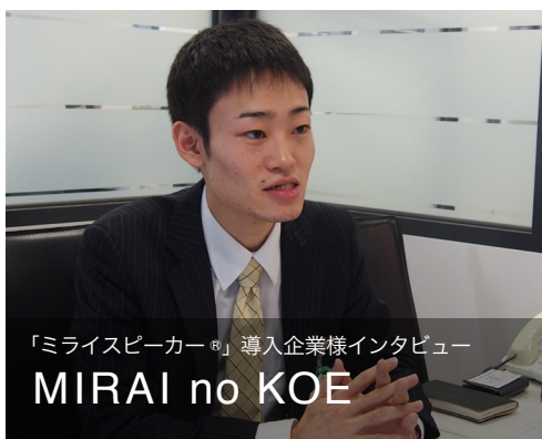
「ミライスピーカー®」導入企業様インタビュー MIRAI no KOE

サービスとして「聴こえ」の環境を整えられるのはもちろん、企業の姿勢がアピールできる商品です。