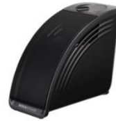
ミライスピーカー・ミニ